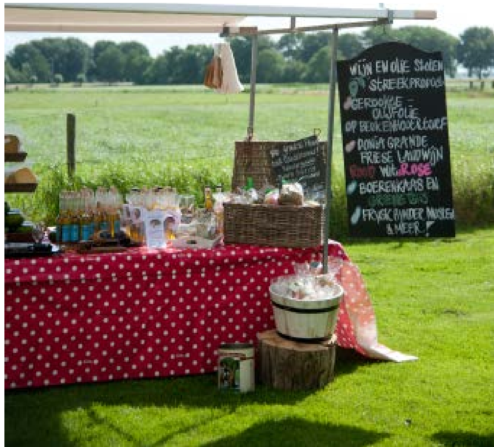
Meer dan twintig kramen staan er op het weiland. Dicht bij elkaar voor een knus sfeertje en alle kramen zijn mooi gestyled.